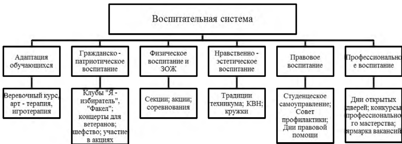
Рисунок 2 – Система воспитательной работы